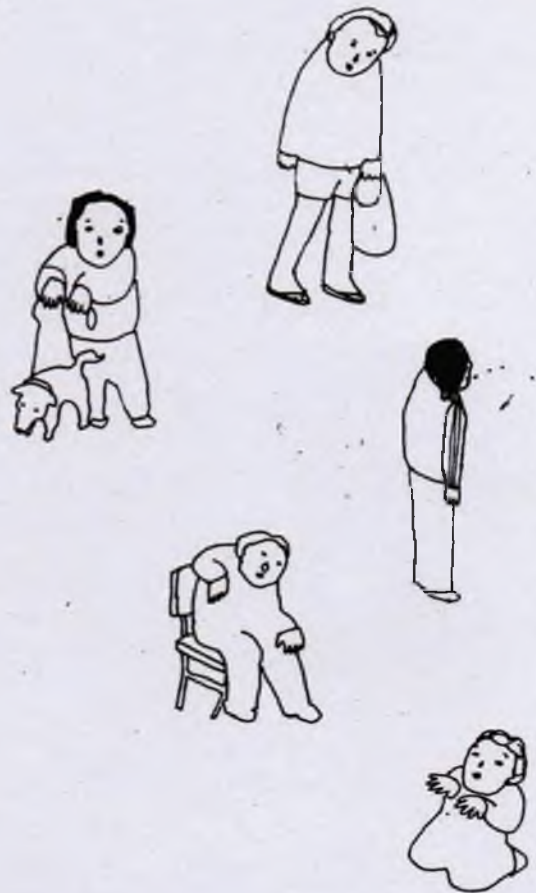
ILLUSTRATION: ORIGI NALKOPIE

Die Perspektive von Leerstandsnutzung, Zwischennutzung und Freiräumen in Wien behandelt eine dreiteilige Studie, deren erster Teil soeben erschienen ist. Die Studie gibt Einblick in Eigentumsverhältnisse und potentielle Nutzungsmöglichkeiten des Leerstandes in Wien. Es werden Fragen gestellt nach Aneignungs- und Nutzungsstrategien, Konzepten der Gestaltung und dem möglichen Mehrwert, den die Öffnung bzw. Nutzung dieser Räume hat. Die Studie ist auf der Seite der IG Kultur abrufbar unter: http://www.igkulturwien.net/index.php?id=236